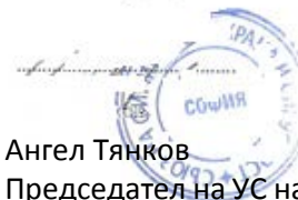
Ангел Тянков Председател на УС на СФОС